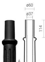
тип окончания „А” – Ø60

F - повышенной термической стойкости – для опор, предназначенных для использования в регионах, где температура воздуха ниже чем -30°C, а также превышает +40°C. Это касается опор чёрного цвета.